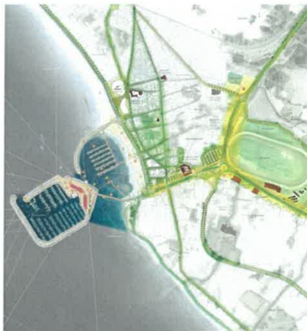
Du port à la ville, la promenade portuaire de Pornichet